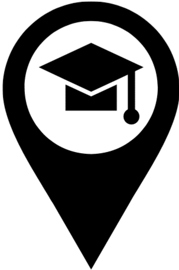
Tabla de contenidos