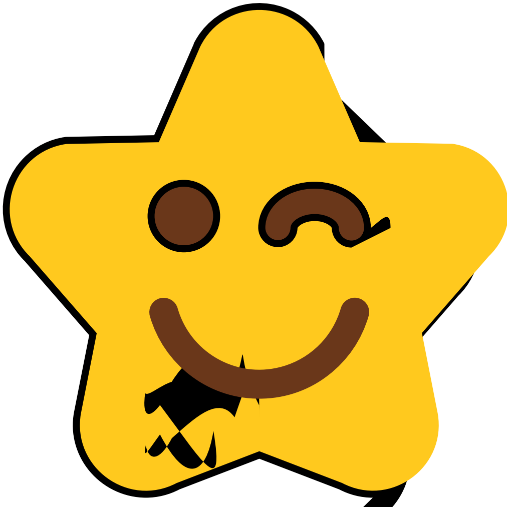
Tabla de contenidos